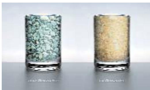
Die Inhaltsstoffe in Denseo Fee durchdringen die Molekularstruktur der Keramik, schaffen so eine höhere Dichte und steigern damit die gesamte Stabilität der Verblendkeramik.