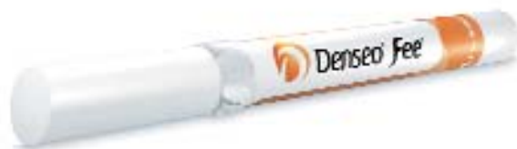
Die patentierte Denseo Fee erfüllt eine ähnliche Schutzfunktion wie der natürliche Zahnschmelz.

Basis zu entwickeln, die den Vorsprung der Natur deutlich verkürzt und damit neue Maßstäbe in der Keramikentwicklung setzt. Denn die Untersuchungen zeigen: Angewandt wie ein Glanzbrand, lässt sich mit dieser neuen Substanz die Qualität einer herkömmlichen Keramikkrone in fast allen Parametern deutlich steigern – zum Teil sogar über 70 Prozent.